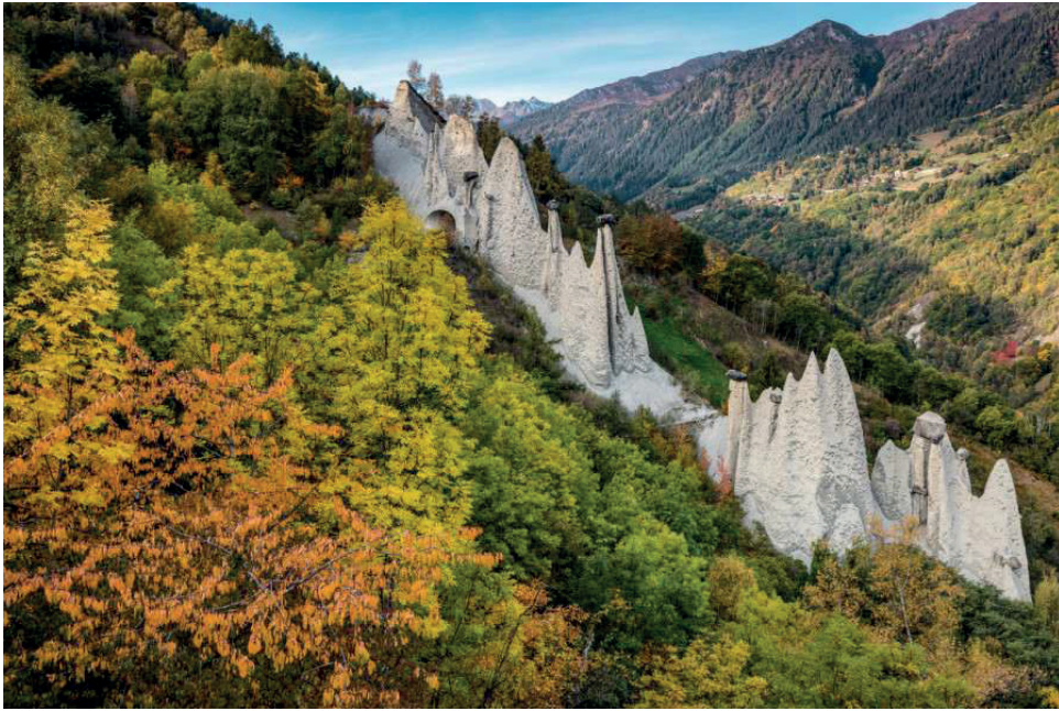
Erdpyramiden von Euseigne