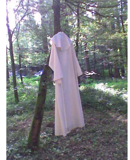
Das liturgische Gewand gibt warm und muss noch etwas warten...

Öppe wes de dunkler wird über de Böim u nes paar Tröpf chöme, spitze mir d'Ohre, obs donneret, ob d'Vögu no pfiffe... u de hei mir innerlech dr Wättergott o scho bätte, no grad e chli z'wärte mit em Räge. Mir gniesse die früschi Waudluft, das Grüen tuet üsne Ouge u üsem Innere guet. Mir gspüre hie starch, dass mir Teil si vom e ne grosse Ganze. Die länge Stämm, wo höch i Himmu recke, bestuume mir gäng wieder mit Ehrfurcht. Mir gspüre, dass näb dä gsprochne Wort o no dr Waud prediget. Höuzlisgrisch si mir gärn.