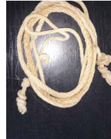
3 Garten Gethsemane