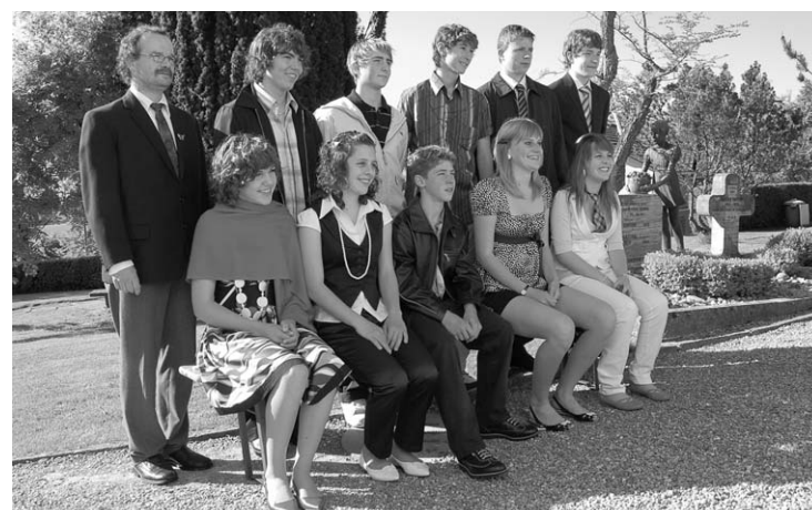
Konfirmandenklasse am Konfirmationstag, 13. Mai 2007