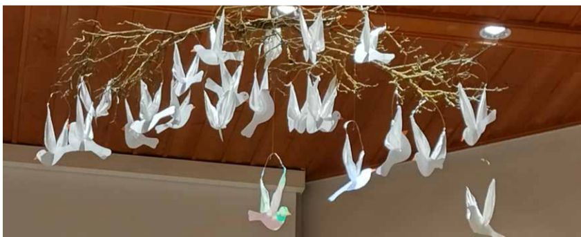
Pfingstlich – im März 2024 durch KUV 4./5. Klassen erstellt und in der Kirche zum Fliegen gebracht.

In den Monaten Juli und August kann an allen Sonntagen getauft werden – bei schönem Wetter im Predigtwald.